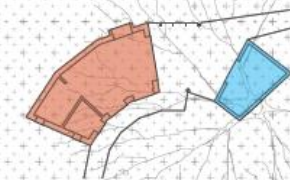
DIAGRAM | OPVARMNINGSPRINCIP

Isoleret, opvarmet Uisoleret væg, gulv og loftbygning