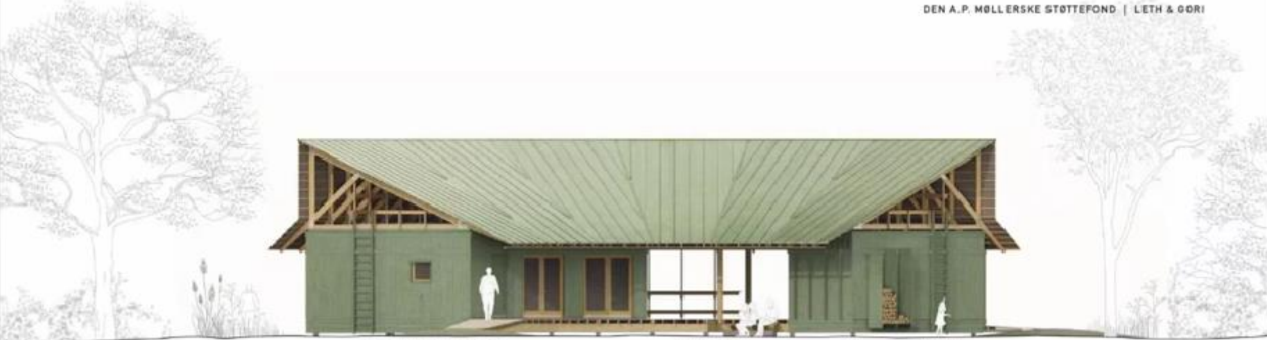
Udgar til venstre | Indgangens overdækning | WC toilet | Udendørs overdækning / terrasse | Depot | Udgang til parken