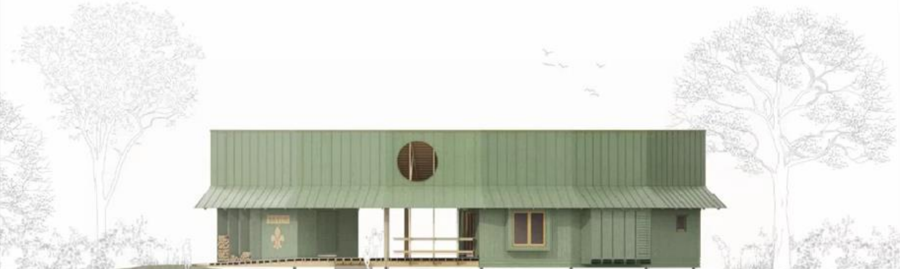
Depot | Indgangens overdækning | Indgangens dør/mur | Sæde-indretning